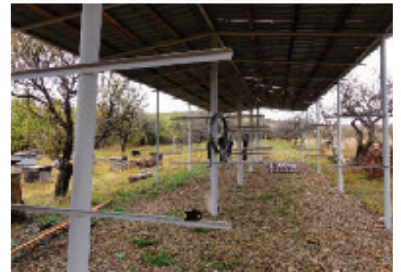
Séchoir d'Aghegi (en voie d'achèvement)

L'idée est de faire des producteurs de ce village des « clients » de la coopérative d'Odzun qui disposera de l'outil de packaging.