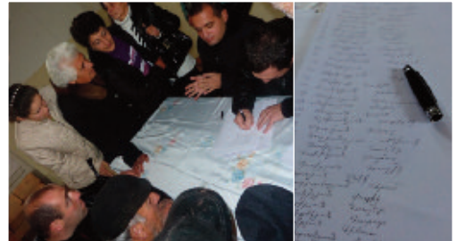
Premiers noms sur la liste des participants à la coopérative de consommation à Odzun