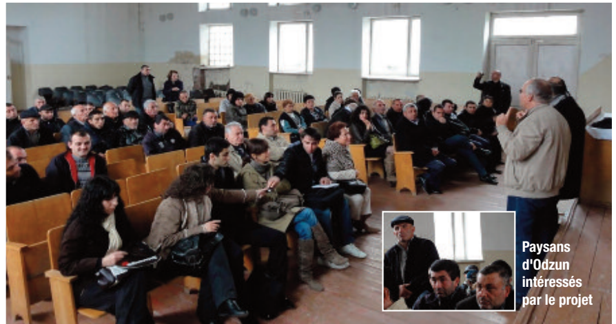
Paysans d'Odzun intéressés par le projet

Les bénéficiaires de ce projet seront les villageois qui adhèrent et travaillent sur cette activité pour en vivre. Des juristes arméniens, diplômés de l'UFAR, ainsi que des étudiants de la Fondation Luys accompagnent le G2iA dans le projet.