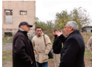
Emplacement du séchoir d'herbes (en projet) au village d'Odzun.

Séance d'information pour la création de la coopérative avec les paysans d'Odzun